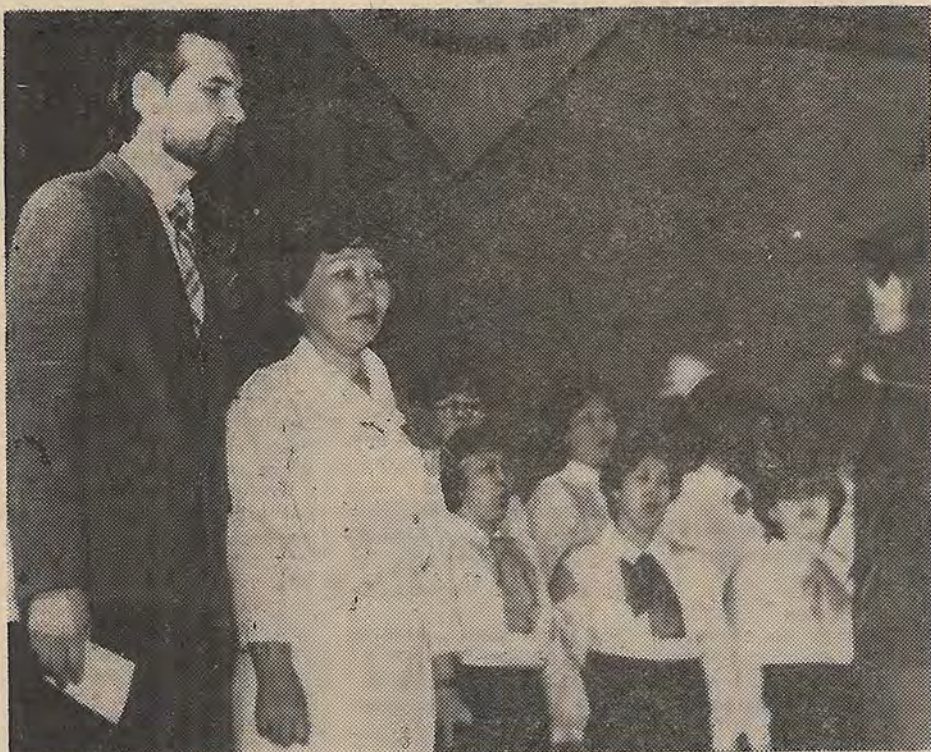
На сцене — хор факультета иностранных языков.